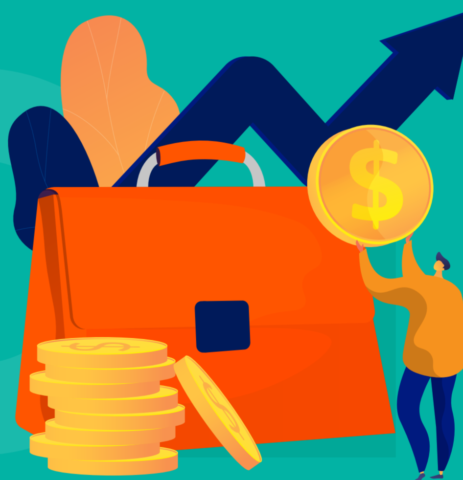
Inversión en Bolsa