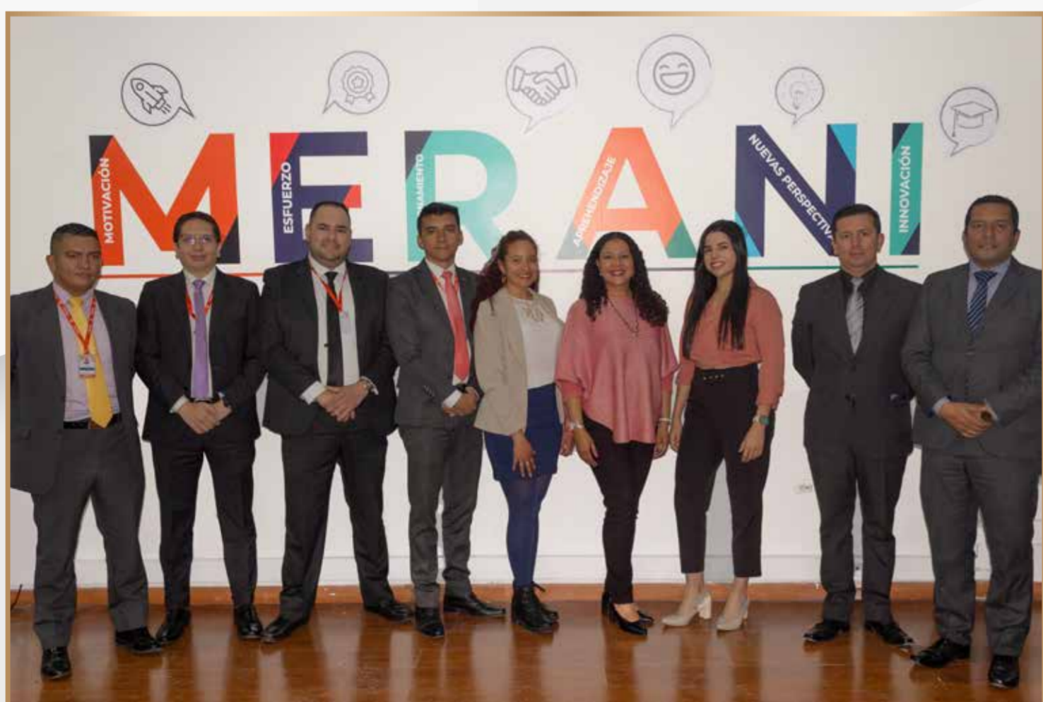
Inducción de docentes

#MeraniTeHaceÚnico #MeraniTeHaceÚnico #MeraniTeHaceÚnico