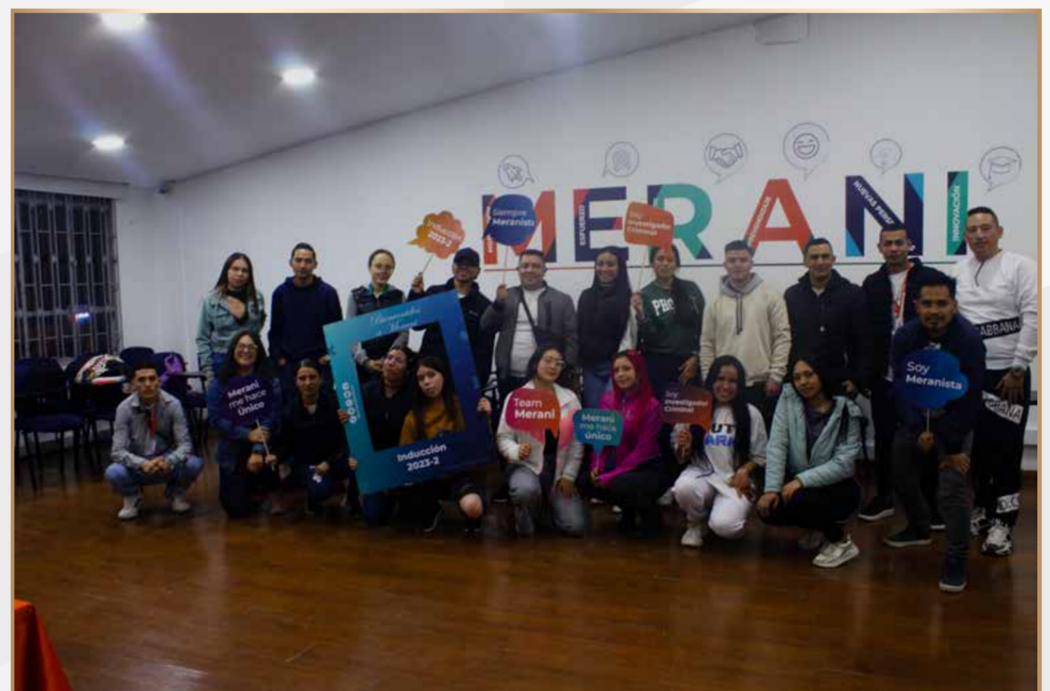
Inducción estudiantes nuevos jornada nocturna