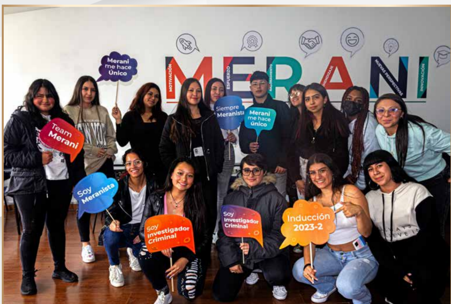
Inducción estudiantes nuevos jornada diurna

Se llevaron a cabo las inducciones para docentes, estudiantes nuevos y antiguos. Estas sesiones tuvieron como objetivo familiarizar a la comunidad Meransita con los recursos académicos, servicios de apoyo y normatividad de la institución.